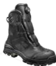
Brimir S3 SRC BRIMS30NR