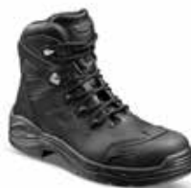
Njord S3 SRC NJORS30NR